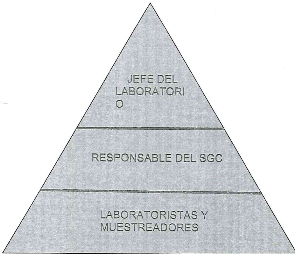
Figura 3. Propuesta de organigrama para la operación de la unidad